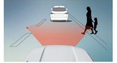
فرامل طوارئ مستقلة تساعد في تجنب أو تقليل مخاطر الاصطدام عن طريق اكتشاف السيارات البعيدة الحركة أو المتوقفة وتحذير السائق مسبقاً.

يستخدم نظام المساعدة في الحفاظ على المسار، كاميرا أمامية لتراقبة علامات المسار المطبعية. وعند اكتشاف محاولة تغيير المسار دون إشارات مزجه يحذر تلقائياً توجيه الطاقة الكهرتائية لإبقاء السيارة داخل المسار المقصود.