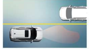
مساعد الضوء العالي (HBA)

يحذر من خطر الاصطدام بالسيارات في النقطة العمياء عندما يفتح أحد الركاب باباً للخروج من السيارة بمجرد أن تكون واقفاً.