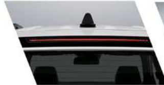
كاشف توقف مركزي عالي التثبيت بتقنية LED