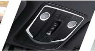
وحدة تحكم علوي مع مفتاح تحكم ضوء الخريطة وفتحة السقف