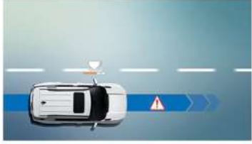
تنبيه جذب انتباه السائق (DAA)

إذا استمر نظام تنبيه جذب انتباه السائق أن مستوى انتباه السائق قد انخفض بشكل كبير، مسوف يحطي تحذيراً مسموعاً ويحرض رسماً على مجموعة الأجهزة.