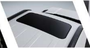
فتحة سقف كهربائية آمنة