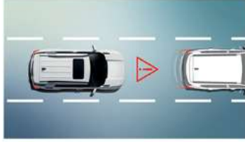
تنبيه بدء تشغيل السيارة الأمامية (FVSA)

إذا استمر نظام تنبيه جذب انتباه السائق أن مستوى انتباه السائق قد انخفض بشكل كبير، مسوف يحطي تحذيراً مسموعاً ويحرض رسماً على مجموعة الأجهزة.