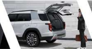
باب خلفي يتم تشغيله بالكهرباء