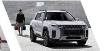
خاصية الإقفال التلقائي