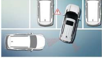
مساعد الصدام الخلفي ( RCTA ) تحذير حركة المرور الخلفية ( RCTW )

عند الرجوع للخلف واكتشاف سيارة تقرب من مسارك، يحذر مساعد الاصطدام الخلفي إحدرا وتحقق الفرامل تلقائياً لإيقاف السيارة وتقليل خطر الاصطدام.