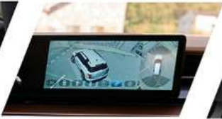
نظام مراقبة الرؤية الشاملة