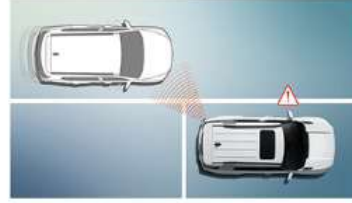
تحذير خروج السلامة (SEW)

يحذر من اقتراب السائق من خلال تنبيه مرئي مألوف وصوت مسموع عندما لتطلق السيارة التي تسير أمامك مباشرة بعيداً.