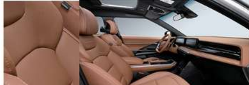
تصميم داخلي أنيق بألوان متعددة