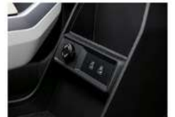
شاحن USB أمامي