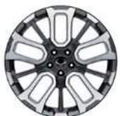
جنوط ألومنيوم مقاس 20 بوصة