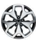
جنوط ألومنيوم مقاس 18 بوصة