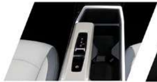
مفتاح تبديل التحويل عن طريق السلك