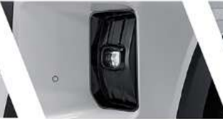
كاشف ضباب أمامي بتقنية LED