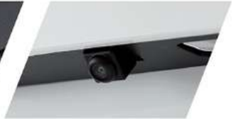
كاميرا رؤية خلفية عالية الدقة