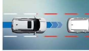
نظام المساعدة في الحفاظ على المسار (LKA) نظام تحذير مغادرة المسار (LDW)

تساعد الترميز اللولبية إذا تم اكتشاف خطر الاصطدام بالسيارات في النقطة العمياء، أثناء تغيير المسارات.