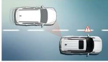
نظام تحذير اكتشاف النقطة العمياء ( BSW ) نظام المساعدة على اكتشاف النقطة العمياء (BSA)

عند الرجوع للخلف واكتشاف سيارة تقرب من مسارك، يحذر مساعد الاصطدام الخلفي إحدرا وتحقق الفرامل تلقائياً لإيقاف السيارة وتقليل خطر الاصطدام.